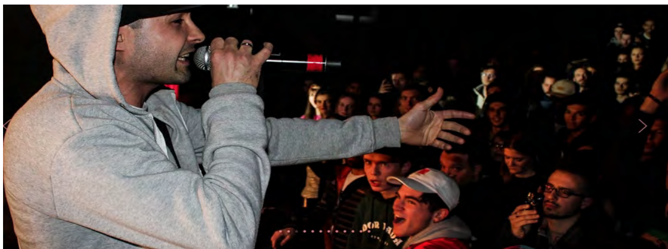
New Spot Music en concert

Depuis 2011, Jeunesse Angevine , association agréée Jeunesse Education Populaire, organise des rassemblements, concerts, spectacles, masters class, ateliers. Ces concerts et spectacles qui réunissent artistes et jeunes talents locaux sont proposés dans différentes structures d'Angers, assurant l'accès à la culture musicale, en appliquant une politique tarifaire non discriminante.