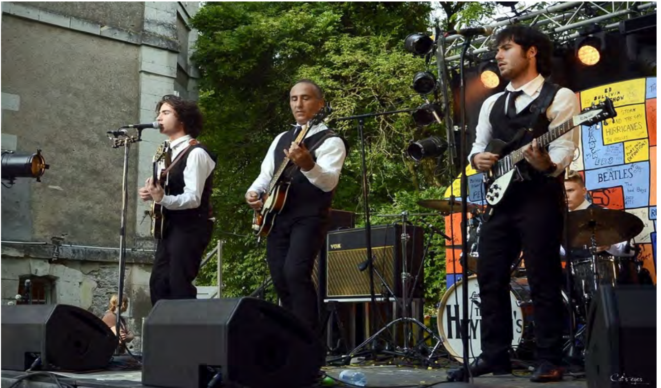
The Heyman's en concert