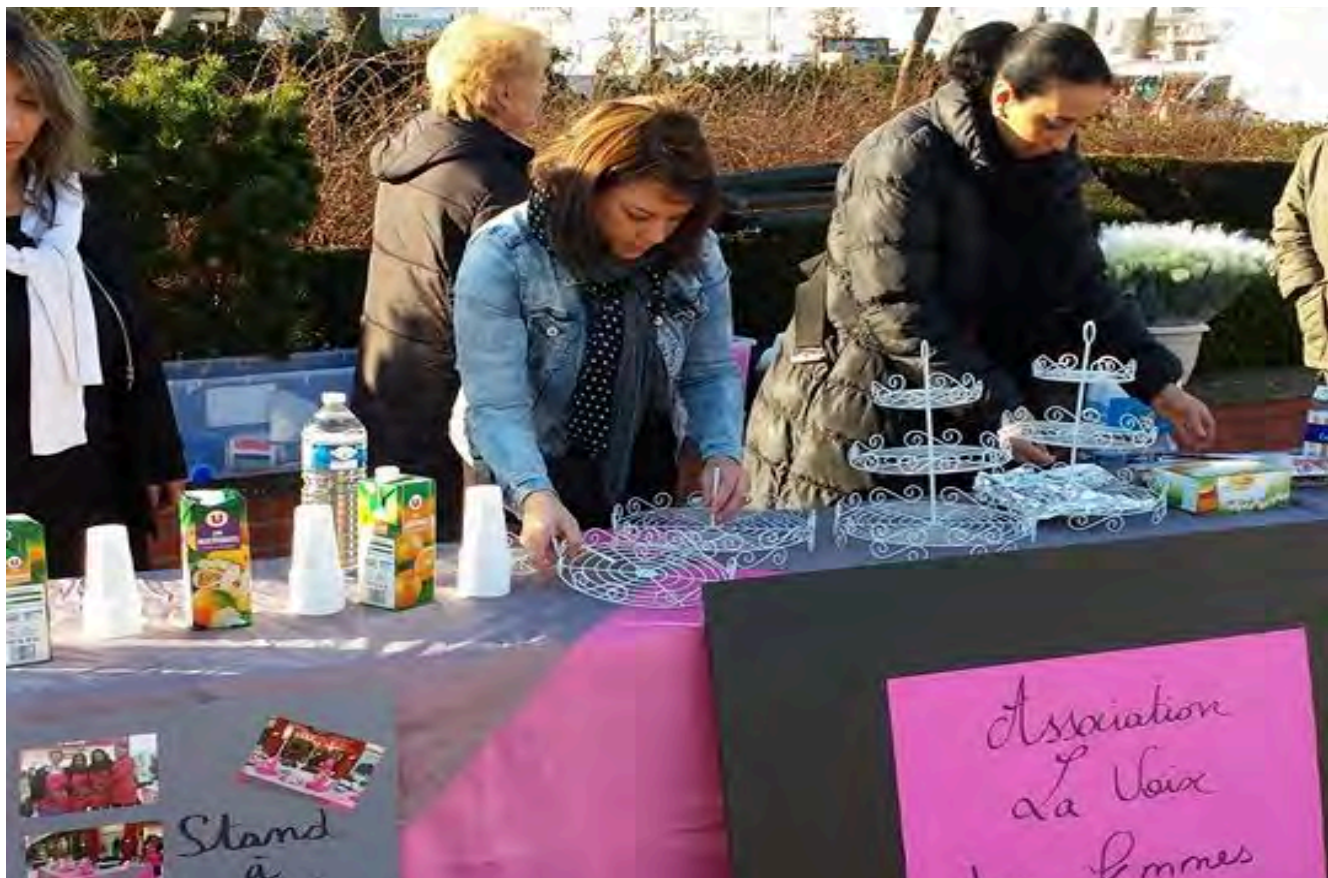
La Voix des Femmes en action

Lutter contre toutes formes de discrimination faites aux femmes de quartiers d'Angers, permettre aux femmes de quartiers de se retrouver, se rencontrer, partager leurs savoirs à travers des manifestations à thèmes, tels sont les objectifs de cette association dont le siège est situé au cœur du quartier de Monplaisir.