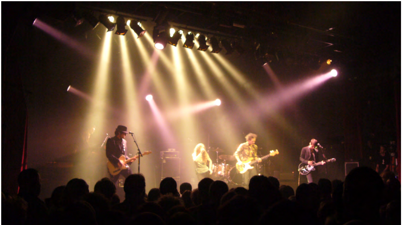
Un concert au Chabada

Salle de concert française et scène de musiques actuelles ouverte en 1994, et bien connue des angevins, Le Chabada s'associe également à l'opération en proposant ses services à des tarifs attractifs et en redistribuant une partie de ses recettes liées au spectacle à l'association.