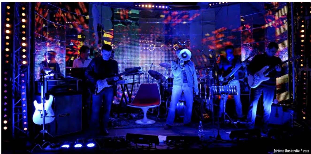
Rope en concert

Pink Floyd , ce n'est pas que "The Wall et Dark Side" affirme le groupe RoPE qui propose de faire découvrir ou redécouvrir l'univers du légendaire groupe de rock progressiste et psychédélique britannique, fondé en 1965. Sur scène, les sept musiciens et techniciens du groupe permettent au public de retrouver l'ambiance et les sensations d'une musique indémodable, touchant plusieurs générations de musiciens et de mélomanes.